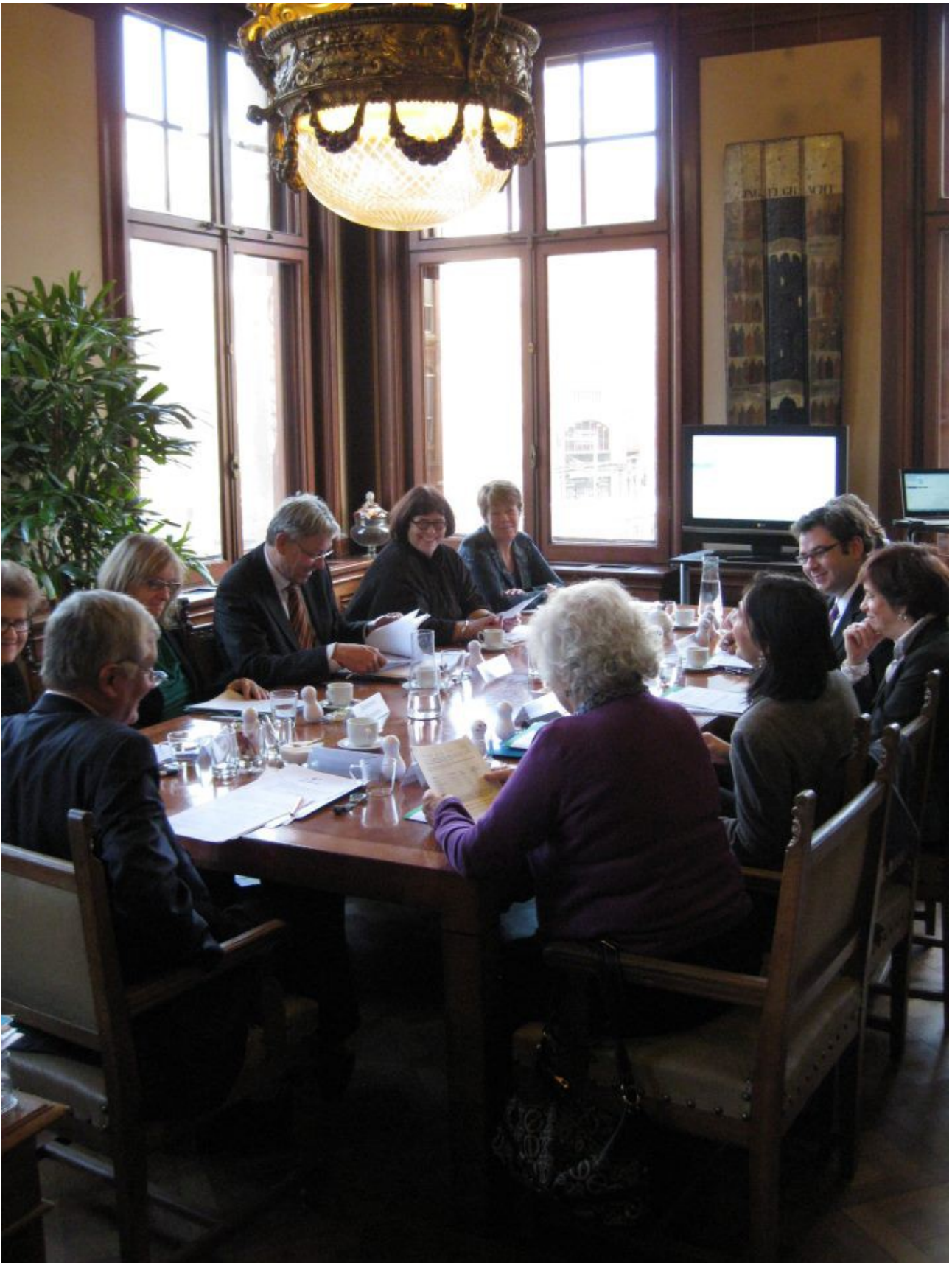
Από την ιδρυτική συνάντηση του Ευρωπαϊκού Δικτύου Τοπικών Συνηγόρων του Πολίτη. Εικονίζονται από αριστερά, η Συνήγορος του Δημότη του Παρισιού, ο Συνήγορος του Δημότη του Άμστερνταμ, η Συνήγορος του Δημότη της Αμβέρσας, ο Συνήγορος του Δημότη της Χάγης, η Συνήγορος του Δημότη της Ζυρίχης, η υπεύθυνη επικοινωνίας του Συνηγόρου του Άμστερνταμ, ο Συμπαραστάτης του Δημότη και της Επιχείρησης του Δήμου Αθηναίων, η Συνήγορος του Ρότερνταμ και η υπεύθυνη επικοινωνίας της Συνηγόρου της Βαρκελώνης.